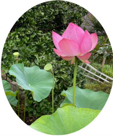
コダイ(オオガ)ハス(古代(大賀)蓮)