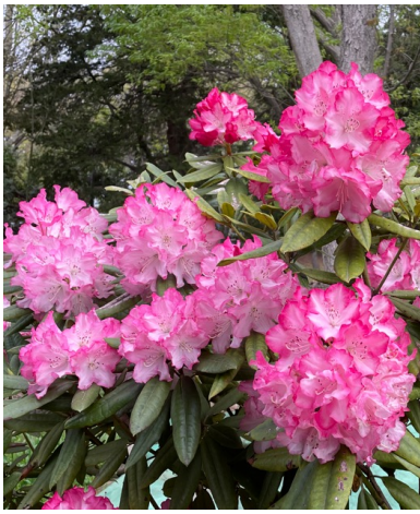
シャクナゲ(石楠花)