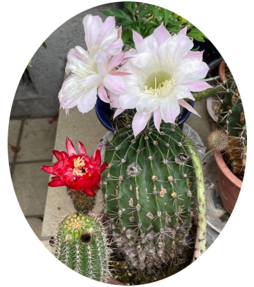
カセイマル(花盛丸)