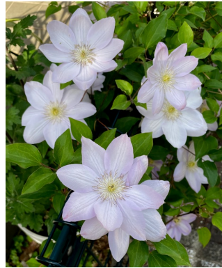
別名：テッセンカズラ(鉄線蔓)