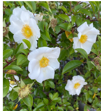
ナニワイバラ(浪花茨)