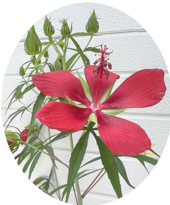
モミジアオイ(紅葉葵)