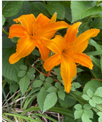
ノカンゾウ(野萱草)