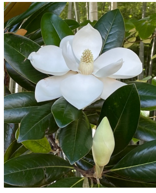
タイサンボク(泰山木)