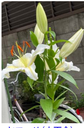
テッポウユリ (鉄砲百合)