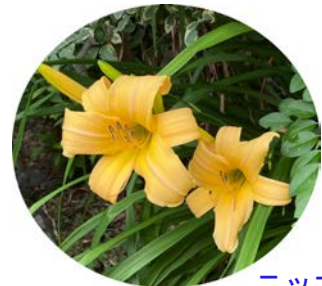
ニッコウキスゲ (日光黄萱)